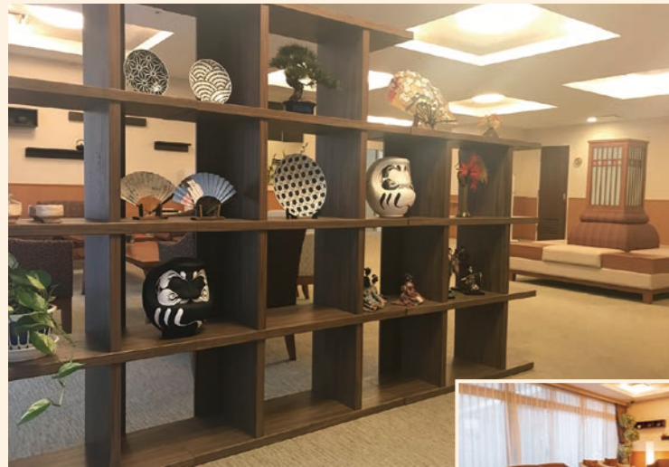
● エントランスホール 落ち着いた温もりが感じられる空間をご用意し、大切なお客様をお迎えいたします。