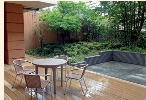
● ウッドデッキ・屋上庭園 夏は心地良い風で夕涼み、冬は暖かな日差しにほっとするひと時をお過ごしいただけます。