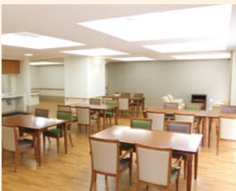
● 食堂兼機能訓練室 ホーム内の厨房でご用意した温かい食事が並びます。