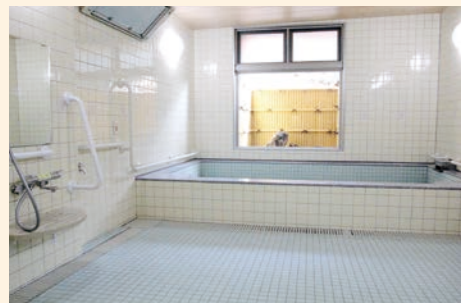
● 浴室 お身体の状態に合わせてご利用いただける様々な浴室をご用意しております。